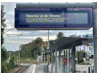
HP Erdmannhausen 25-09-24

Offensichtlich hat der angrenzende Grundstückseigentümer entsprechend dem Nachbarschaftsrecht begonnen, die von seinem Grundstück ausgehende Gefahr zu beseitigen. Bei Gefahr in Verzug wäre InfraGO berechtigt gewesen, diese Arbeit sofort zu Lasten des Eigentümers selbst auszuführen. Spätestens ab 25.09. waren die Gleise frei geräumt. Statt dessen Untätigkeit Der DB Pressemitteilung nach entsteht der Eindruck, die gesamte Streckenabschnitt Marbach- Kirchberg sei verwüstet. Bei einer Streckenbegehung von Fahrgästen konnte lediglich im Bf Kirchberg dieser Hangrutsch festgestellt werden.