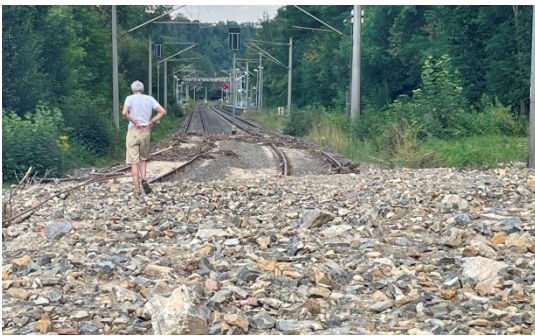
Bf Kirchberg 17-07-24