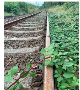
Gleise beginnen zu verunkrauten