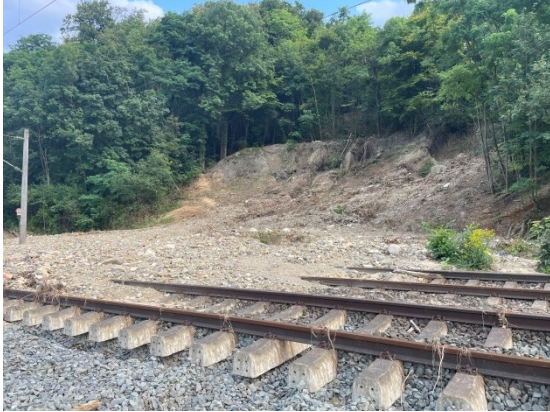
Bf Kirchberg 19-07i- 24

Die Kleine Murrbahn (S4) wurde 1996 für den Güterverkehr elektrifiziert um auf direktem Weg von Nürnberg nach Kormwesheim zu gelangen. Vorher fuhren die Güterzüge auf der stark belastete Remsbahn über Aalen und mussten in Untertürkheim kopfmachen. Fahrzeiterparnis über die Kleine Murrbahn: 35 Minuten.