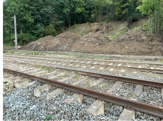
25-09-24. Gleise wurden beräumt, von Dritten,