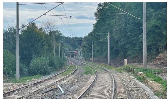
25-09-24. Gleise von Dritten geräumt.

Offensichtlich hat der angrenzende Grundstückseigentümer entsprechend dem Nachbarschaftsrecht begonnen, die von seinem Grundstück ausgehende Gefahr zu beseitigen. Bei Gefahr in Verzug wäre InfraGO berechtigt gewesen, diese Arbeit sofort zu Lasten des Eigentümers selbst auszuführen. Spätestens ab 25.09. waren die Gleise frei geräumt. Statt dessen Untätigkeit Der DB Pressemitteilung nach entsteht der Eindruck, die gesamte Streckenabschnitt Marbach- Kirchberg sei verwüstet. Bei einer Streckenbegehung von Fahrgästen konnte lediglich im Bf Kirchberg dieser Hangrutsch festgestellt werden.